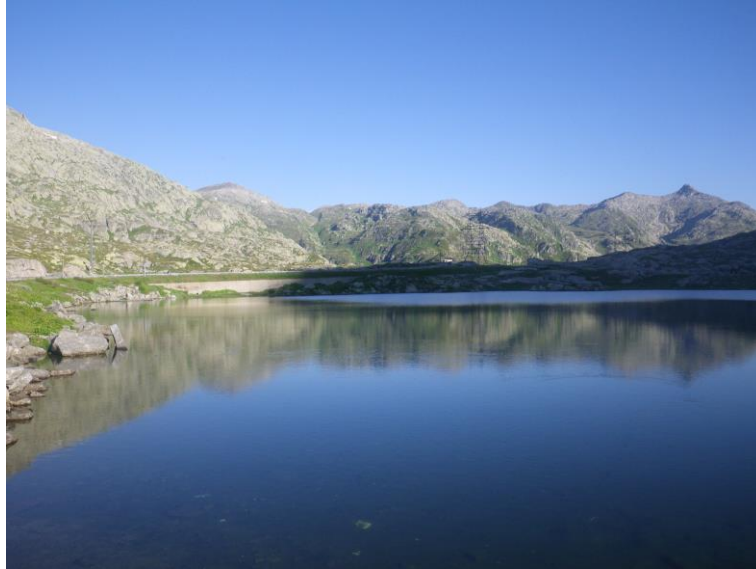
Morgenstimmung am Lago della Piazza