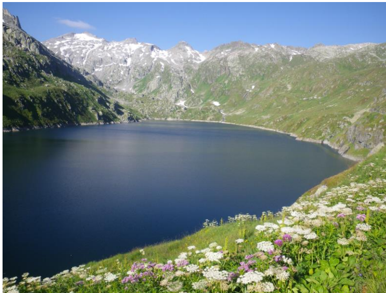
Der dunkelblaue Lago di Lucendro