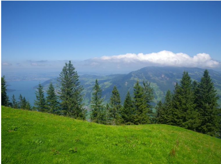
Wunderbare Aussicht auf den Zugersee