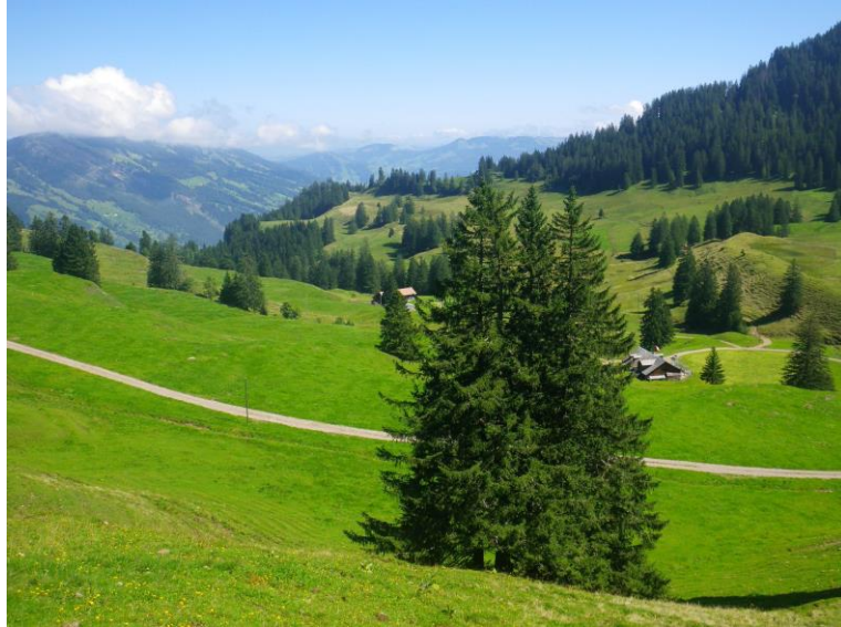
Aufstieg via Obermatt nach Hinder Dosse