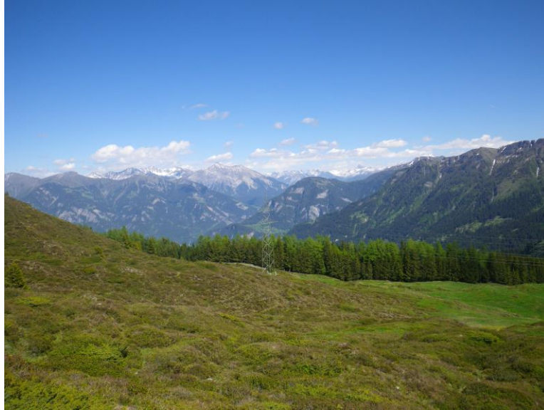
Schöne Aussicht auf die Bündner Berge