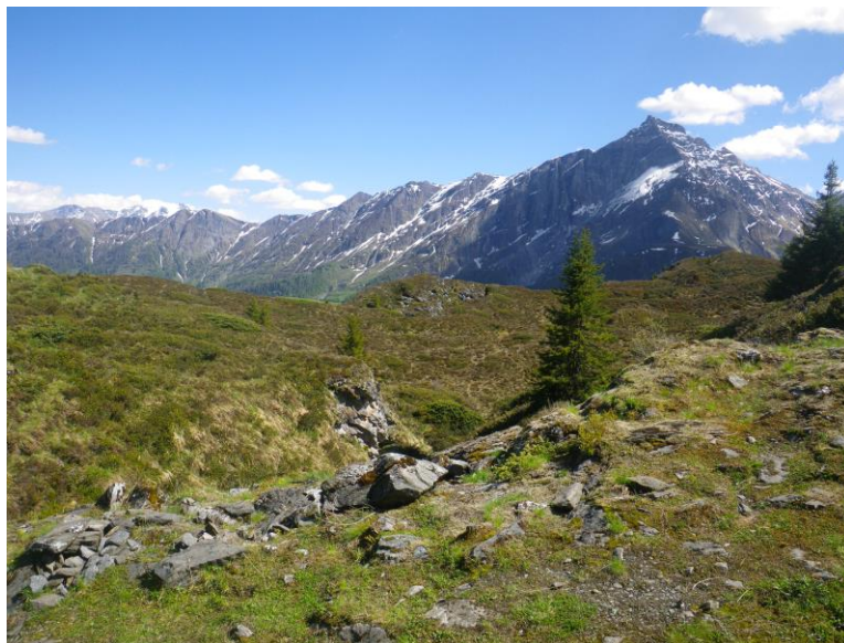
Im Naturpark Beverin